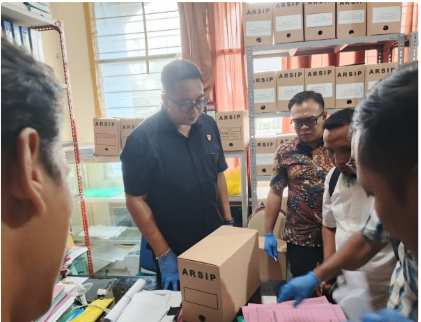
Saat Pengeledahan di Dikbud NTB, Jumat (13/12/2024)

MATARAM, NTB – Dugaan praktik pungutan liar (pungli) dalam proyek Dana Alokasi Khusus (DAK) tahun 2024 di SMK 3 Mataram terus diusut. Dalam pengembangan kasus ini, Tim Tindak Pidana Korupsi (Tipidkor) Polresta