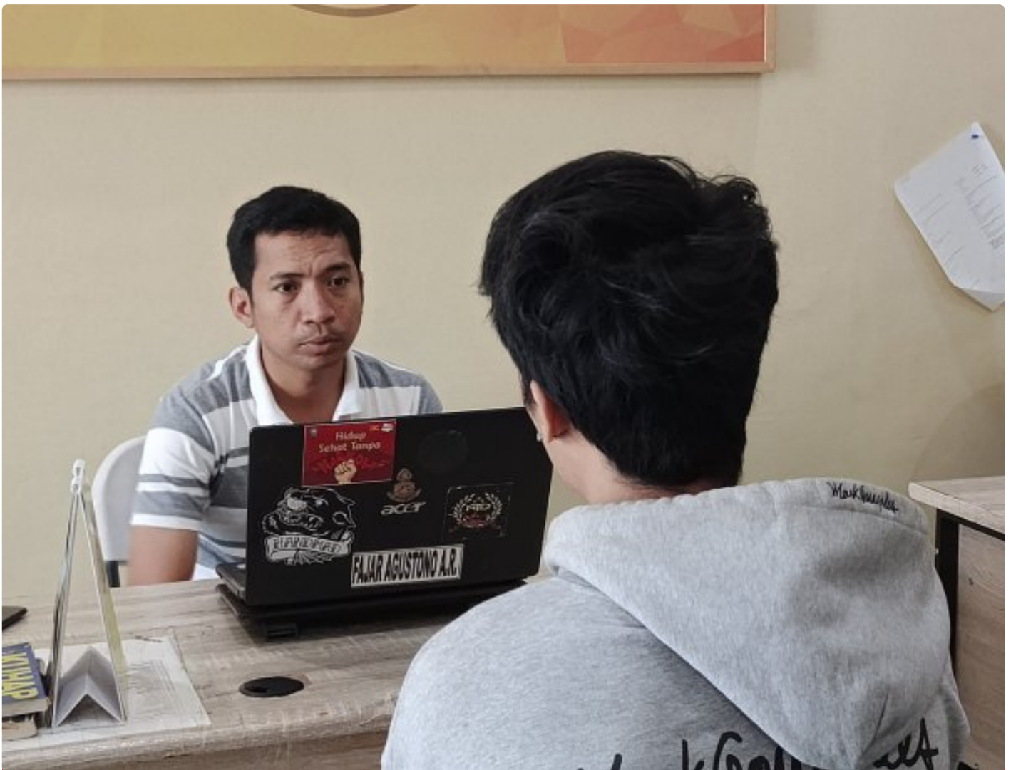
Salah satu terduga yang diamankan sedang diperiksa penyidik Sat Resnarkoba Polresta Mataram, (03/10/2024)

Mataram NTB - Diduga melakukan penyalahgunaan Narkotika, 4 Laki-laki dan 2