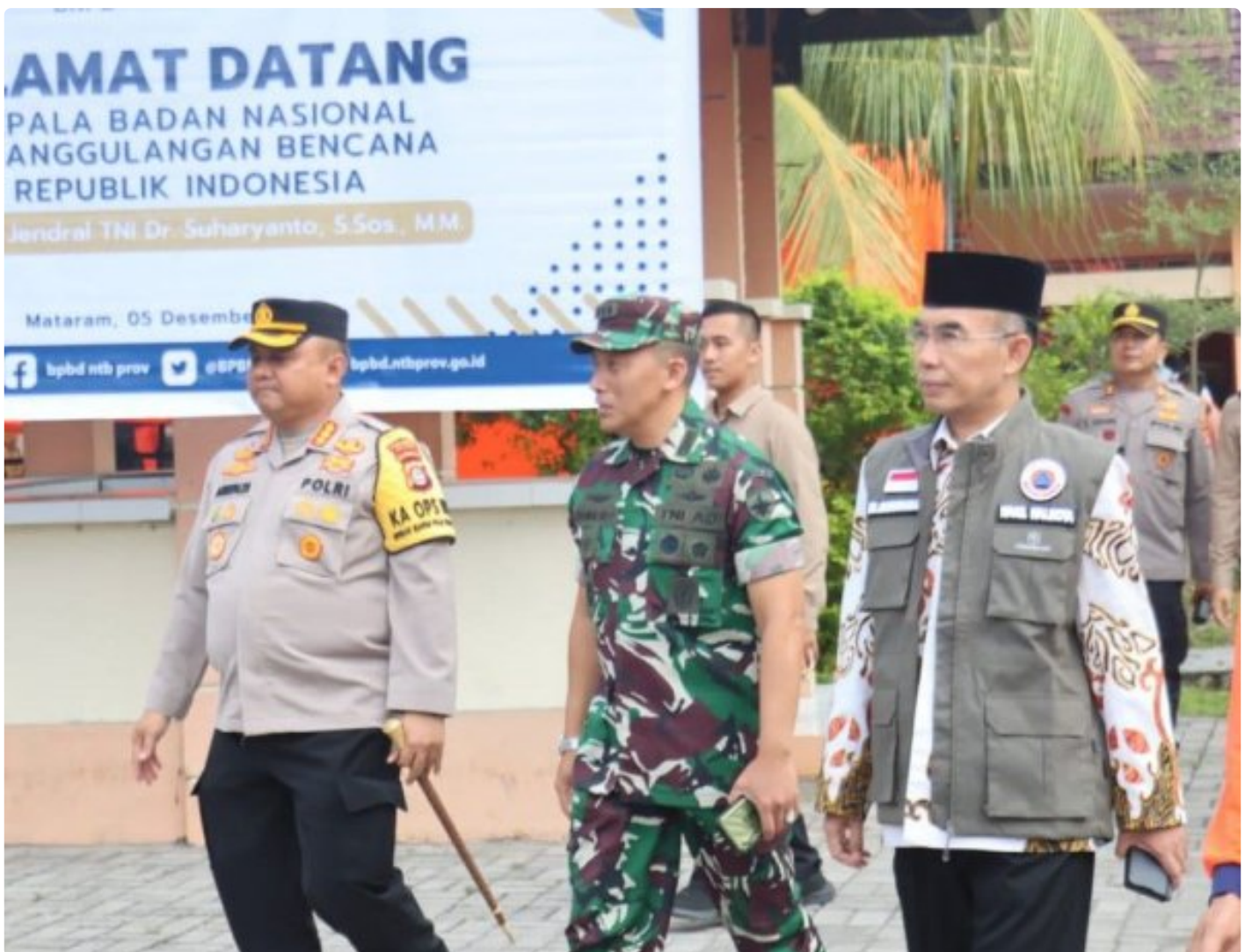
Kapolresta Mataram (Kiri) saat menghadiri acara Peletakan batu Pertama pembangunan gedung Pusdalops BPBD NTB, Kamis (05/12/2024)