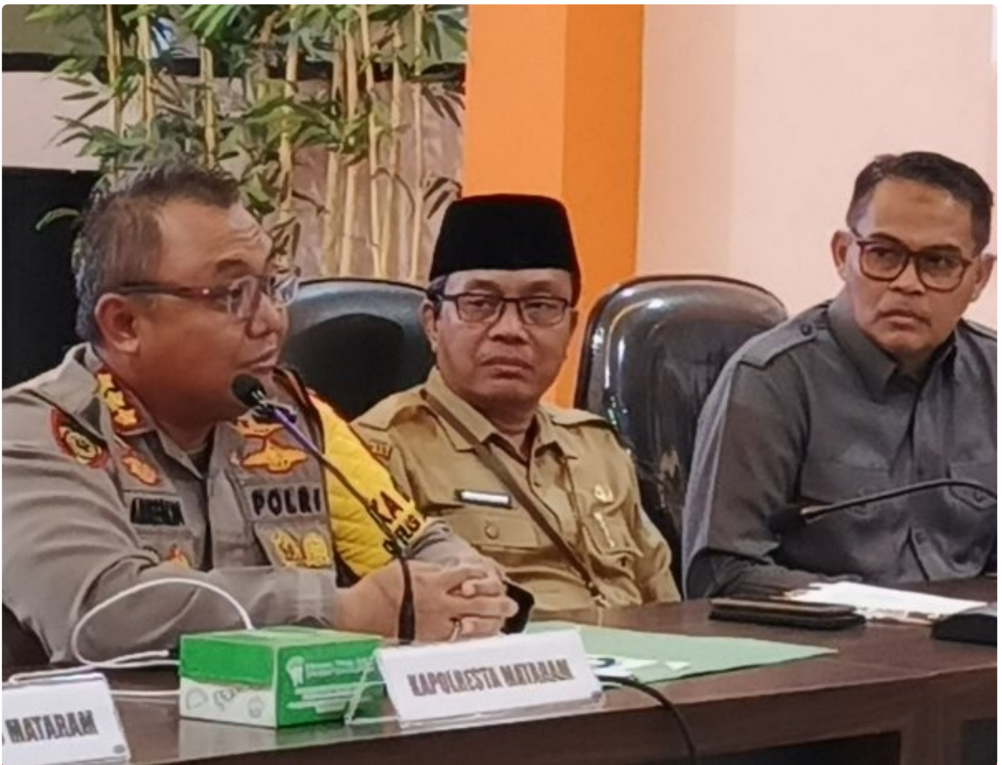
Kapolresta Mataram (Kiri) saat memimpin Konferensi pers akhir tahun, Selagi (31/12/2024)

MATARAM, NTB – Polresta Mataram mengakhiri tahun 2024 dengan menggelar